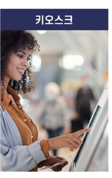
병원, 식음료, 휴게소, 영화관, 골프장, 공항, 은행, 프렌차이즈 등