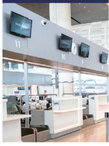
전광판, 옥외광고, 전자게시판 등