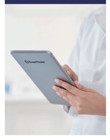
태블릿을 활용한 주문 및 결제